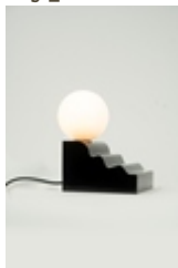
Lampe "Moulure" assise