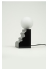
Lampe "Moulure" debout